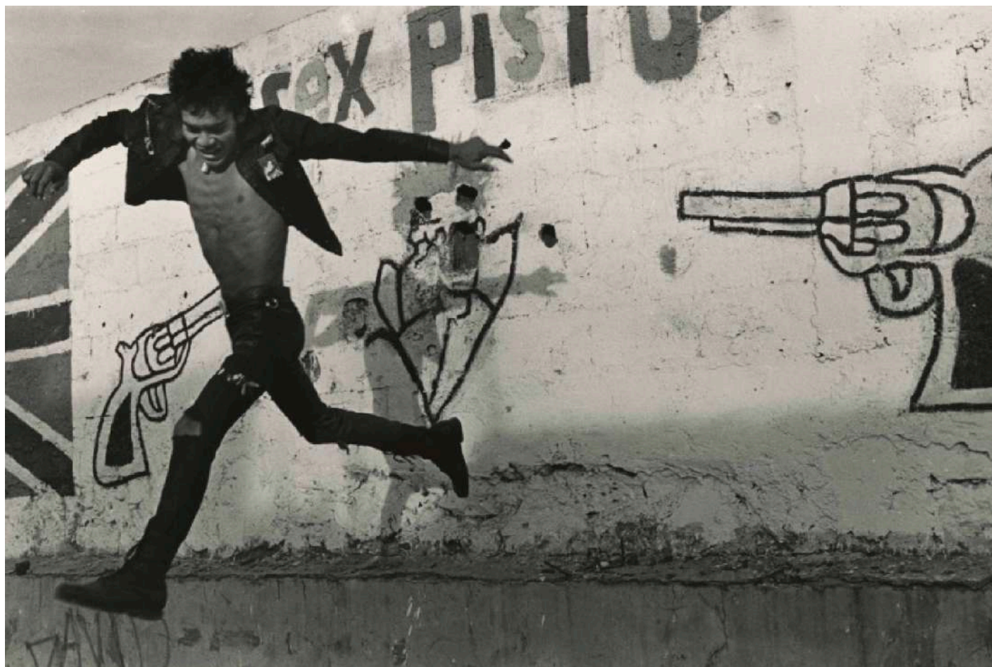
Volando bajo, Mexico, 1989