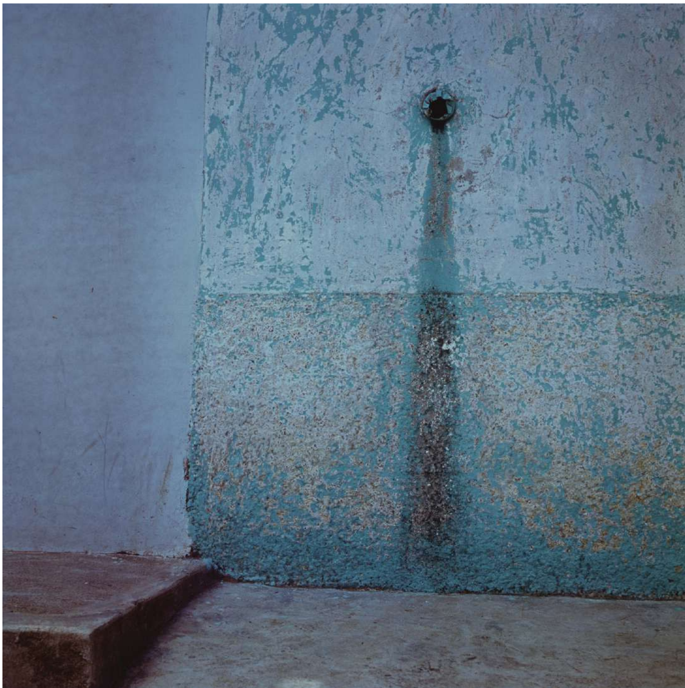
Sans titre, Colombie, 1979