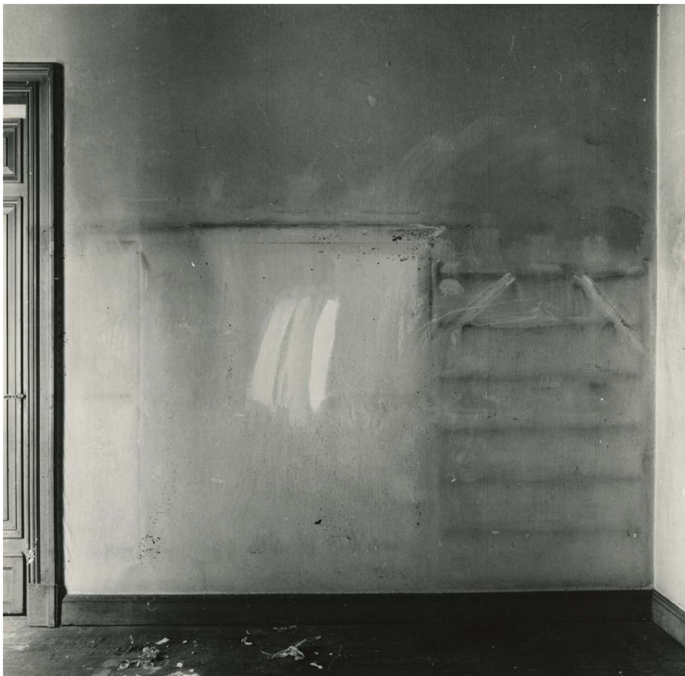
Libertad 1212, Buenos Aires, Argentine, 1982 © Óscar Pintor