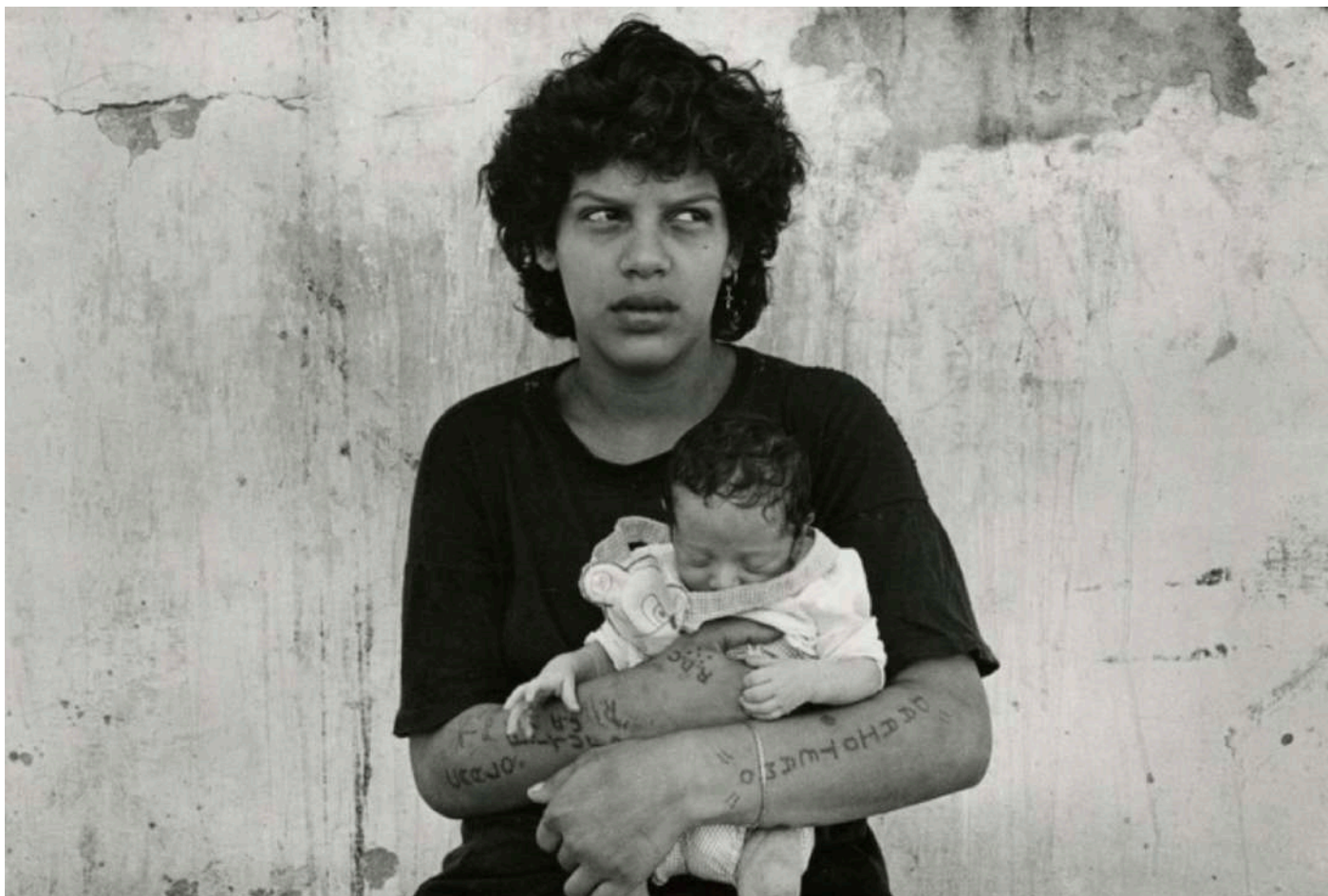
Sans titre, série Mujeres Presas, Cárcel N° 8 de Los Hornos, La Plata, Argentine, 1991-1993