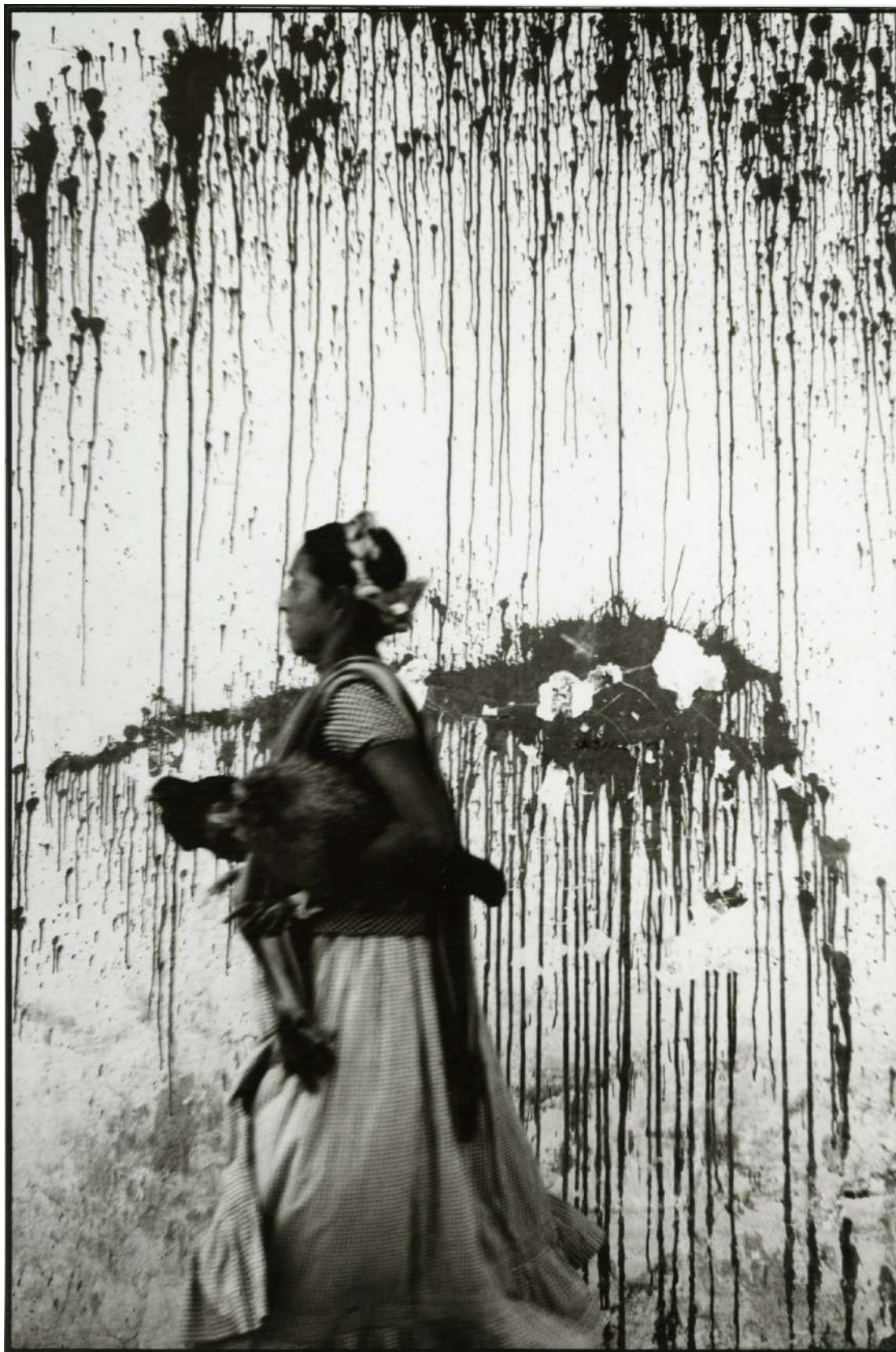
Les poulets, Juchitán, Mexique, 1979