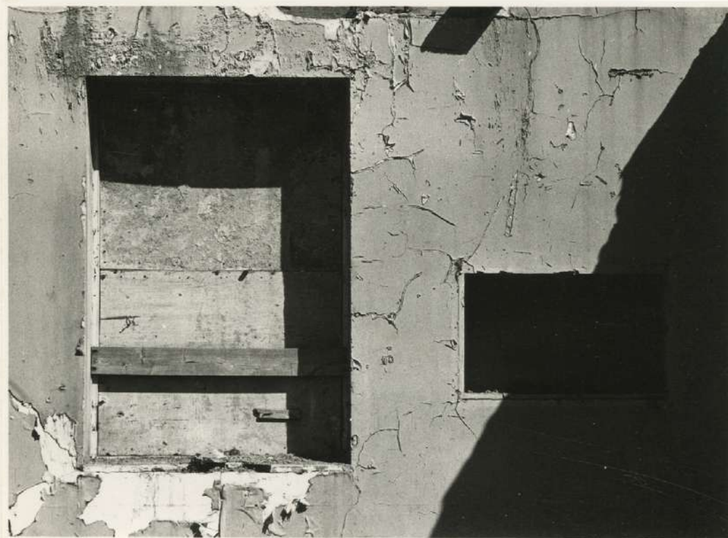
Série Fermetures, Santiago, Chili, 1978