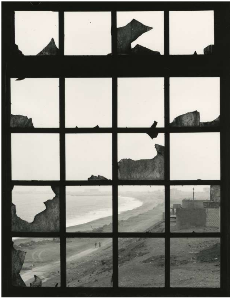
Ventana XXVI. La Perla, Callao, Pérou, 1976